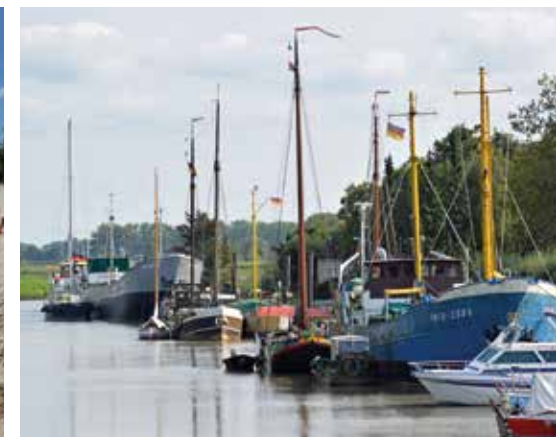
Hafen Wischhafen

Jedes Gesundheitsangebot ist mit jeder Unterkunft kombinierbar. Egal ob Hotel, Privatzimmer, Ferienwohnung, Camping- oder Wohnmobilstellplatz. Gerne beraten wir Sie bei der Unterkunftssuche und stehen Ihnen mit Rat und Tat zur Seite.