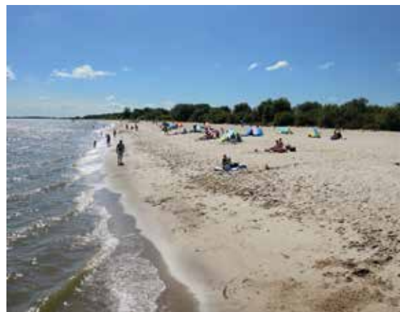
Elbstrand Krautsand ©Elsen

Foto 1 ©May-Britt Müller / Foto 2-3 ©Martina Wagner, Samtgemeinde Oldendorf-Himmelpforten