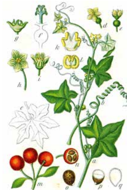
Johann Georg Sturm 1796: Bryonia dioica (Rotfrüchtige Zaunrübe)

Meine Praxis liegt auf unserem Bioland-Hof in Oederquart-Bruch. Termine werden nach Vereinbarung vergeben.