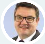
Holger Falcke | Samtgemeindebürgermeister Samtgemeinde Oldendorf-Himmelpforten