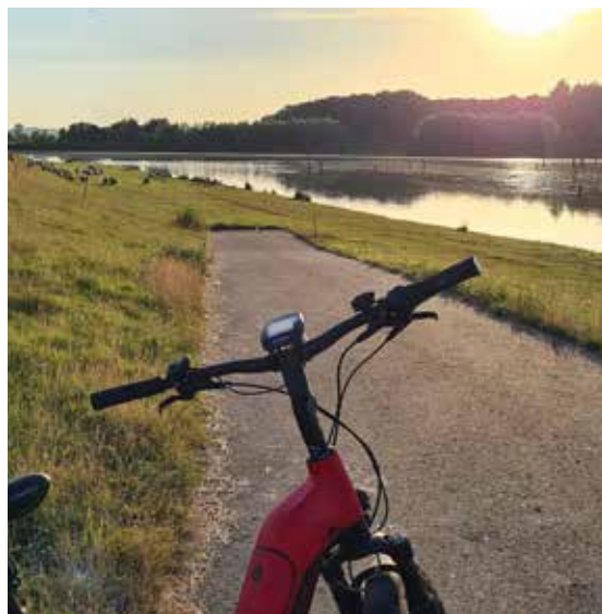
Foto 1 ©May-Britt Müller / Foto 2-3 ©Martina Wagner, Samtgemeinde Oldendorf-Himmelpforten